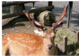
新しく生えてきた袋角

シカの仲間の特徴は、やはり角です。エゾシカの角はオスにしかありません。この角を使って、オスはオスをめぐって争います。