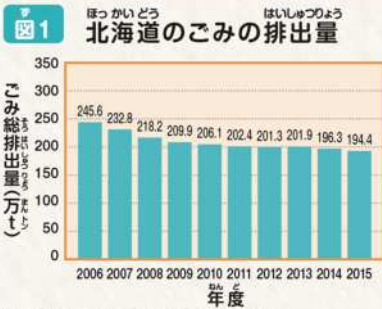
北海道環境生活部環境局循環型社会推進課 一般廃棄物処理事業実態調査結果の概要(平成27年度実績)

地球のために「私たちができること」 皆さんの生き物が暮らす地球には、空気・水・ガスなどのさまざまな資源があるよね。私たち人間は、それらを使って生活をしているけれど、近年豊かさや便利さを求めるあまり、地球の環境が変わってきているといわれているよ。 これから100年、1000年先も、地球が美しい星であるために、私たちは毎日の生活を見直し、工夫していかなくてはならないよ。ごみを増やさないことも、大事な行動のひとつなんだ。