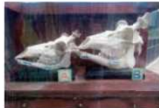
頭骨を展示しているので前面を確認してみよう

日本にはニホンジカが広く分布していますが、北海道には、ニホンジカの亜種のエゾシカが生息しています。エゾシカは体が一番大きく、大人のオスになると体重が100kgをこえます。エゾシカは北海道全域に生息していて、特に道東にはたくさん生息しています。