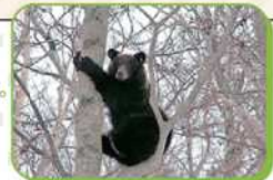
木の上のヒグマ。木登りもできるんだ。