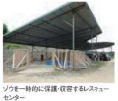
ゾウを一時的に保護・収容するレスキューセンター