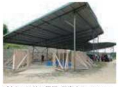
ゾウを一時的に保護・収容するレスキューセンター

「パーム油」。今からその使用をやめることは現実的に無理です。そこで旭山動物園では「ボルネオへの恩返しプロジェクト」という取り組みを始めました。私たちの生活がオランウータンやゾウを絶滅に追い込んでしまっている。それなら犠牲になっている動物たちに直接「ありがとうの気持ち」を返していこう、という取り組みです。