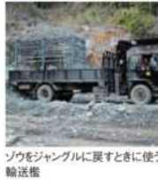
ゾウをジャンブルに戻すときに使う輸送機