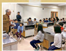
南月寒小学校ミニ児童会館で、 川柳教室を行いました!