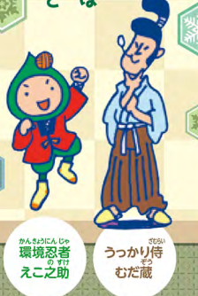
表1 みんなはこんなうっかりをしていないかな?

寒い冬は、暖房をはじめたくさんのエネルギーを使う季節。でも、少しの工夫で省エネができるかな? エコ之助とどんなことができるかな? エコ之助とおだ蔵が紹介するよ!