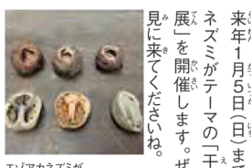
エゾアカネズミが穴を開けて食べたクルミ、リスが割って食べたクルミ

エゾアカネズミは、北海道に多くすんでいる野ネズミです。円山動物園内の自然豊かな森にも暮らしています。エゾヤチネズミのヤチは湿地を意味する「谷地」からきています。茶色い毛に丸つこ顔と小さな耳、短めの毛のなしいっぱが特徴。樹皮が好きで、ドングリや