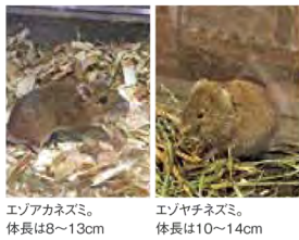
エゾアカネズミ 体長は8～13cm エゾヤチネズミ 体長は10～14cm