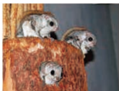
地面に下りることはほとんどありません