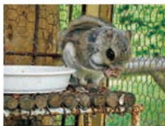
木の葉や芽、皮、種子、果実などを食べます

北海道のほぼ全域にすんでいて、体長は約15cm、大人になっても体重は100gほどの小さい動物です。