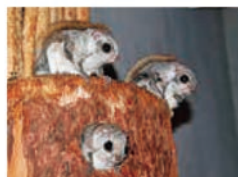
地面に下りることはほとんどありません

みなさんはエゾモンガという動物を知っていますか？名前前は知っていても、実際に見たことがある人は少ないと思います。エゾモンガは、夜行性動物を代表する動物なので、人の関わりが少なく、身近な所についてあまり知られていないのです。