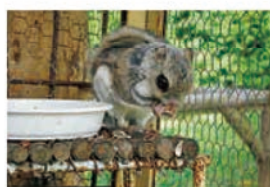
木の葉や芽、皮、種子、果実などを食べます

北海道のほぼ全域にすんでいて、体長は約15cm、大人になっても体重は100gほどの小さい動物です。