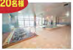
賞品提供：つきさむ温泉

札幌にある、つきさむ温泉の源泉かけ流し風呂は、刺激が少なく、はだがスベスベになる美はだの湯。家族で入って、心も体もすっきりさわやかになってね!