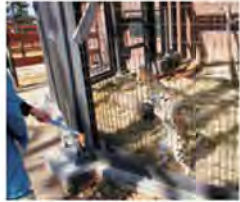
えさのヒヨコをねらっています