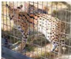
頭の後ろと耳、尾はしま模様