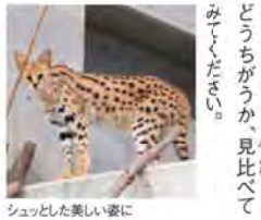
シュッと美しい姿にひきつけられます

「サバルキヤット」は、名前から分かる通りネコの仲間です。小さい顔に大きな耳、長い手足、ほっそりとした体に美しい毛皮をまとい、まるでネコの世界のモデルのようです。しかし、気性はあらなく、するどいきばつめを持っています。また、美しい毛皮のためにかなりの対象となったり、家畜をおそう害獣として駆除されることがあります。3月もジャンプしてつかまえることもできます。足が速く、木登りや泳ぎも得意です。