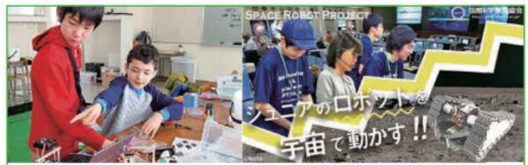
SPACE ROBOT PROJECT シアのロボットを宇宙で動かす!!