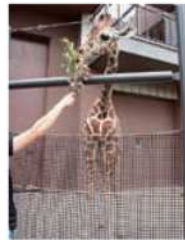
テンスケは育ち盛りの2歳。頭頂までの高さは約5.5m

地球上で一番背の高い動物、それはキリンです。足先から頭頂までの高さが、オスでは4~5mをこえる個体もいます。大型化することで肉食動物から身を守ってきました。さらに、目と耳が長く、いち早く外敵を見付けられるため、周りには草食動物が集まって来ます。長い首は高い木の葉を食へるときや、ネッキング