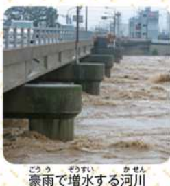
豪雨で増水する河川

日本のいろいろな場所で、台風や集中豪雨などによる洪水や土砂災害が発生していることは、みんなもニュースなどで知っているよね。札幌市では、1981年以來は大きな水害は起きていないけれど、2004年には台風の暴風により死者をふくむ多くの被害が発生した。みんなが住む街でも、集中豪雨や大雪などによる災害がいつ起こってもおかしくないんだ。