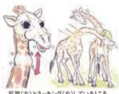
反芻(左)とネッキング(右)しているところ

「飼育員さんへの質問」を受け付けているよ! 聞きたいことを送ってね! 応募方法は10ページを見てね。