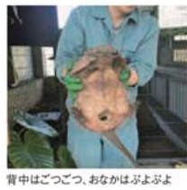
背中がごつこつ、おなかはぶよぶよ

よこのおんこ かたごんこ かたいこうらの帯が特徴的なムツオビアルマジロ。このこうらは、身を守るためにひふや体毛が進化したもので、天敵であるネコ科のオセロット、イヌ科のヤブイヌやタテガミオオカミなどの鋭いキバも簡単には通さないほどのかさです。アルマジロとは、スペイン語で「よい意味。ムツオビアルマジロ