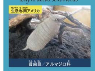
生息地:南アメリカ