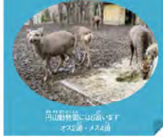
円山動物園にはおひきす オス2頭・メス4頭