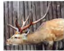
春から秋にかけて生える鹿角には茶色い毛が生えていて、

2倍にふくらむ?! エゾシカの白いおしり エゾシカは北海道全域の森林に生息しています。草や木の葉、果実、キノコなどを食べ、大きなオスでは体重が150kgほどにもなります。夏毛は、木もれ日の中で姿がまぎれるように、茶色に白い水玉模様。冬毛は灰色がかかった茶色で、木などに近い色になります。おしりの毛だけ白いのは、うす暗い森にいる時や敵