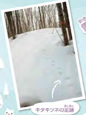
キタキツネの足跡

雪があるからこ見えるものがいっぱい!! 冬しか見られない、生き物たちの営みがあるよ。 どんなものが見られるのか、紹介するね!