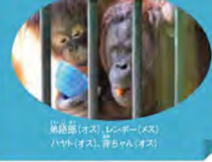
弟路郎(オス)、レノボー(メス)、ハヤト(オス)、赤ちゃん(オス)