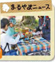
取材協力:園報「札幌円山動物園」長野野子(長野)