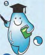
札幌市水道局 公式キャラクター ウォッピー