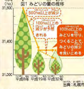
図1は、札幌市内の樹林地や草地、農地、水面、公園など、植物のみどりでおおわれた面積を表しているよ。平成8年から19年までの11年間で、みどりの量はなんと500ha以上も減ってしまったことがわかるな。これは、建物などができたことにより、農地が大きく減少してしまったからなんだ。