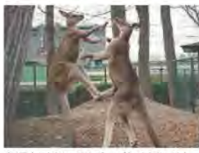
オーストラリアのたかひでは、ジャンプキックをすること!

オオカンガルーは、オーストラリアの中でも特にタスマニアに多く生息している大型のカンガルーです。体毛の色から、ハイイロカンガルーとも呼ばれます。森林や荒地で10頭ほどの群れを作り、後ろ足の強いバネの力と太いしっぽを使って、ジャンプして