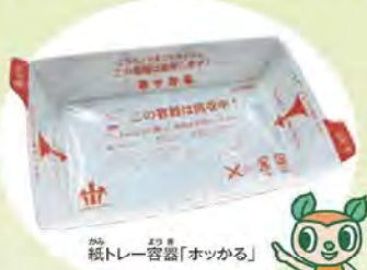
紙トレー容器「ホッかる」