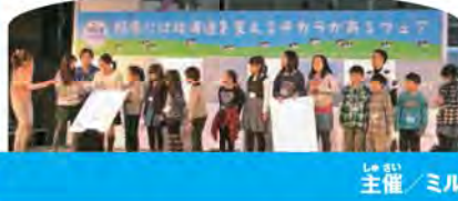
主催 / ミルクランド北海道

「本物の酪農家のみなさん」と一緒に「かべ新聞」をつくろう!というプログラム。集まってくれたみんなは酪農家の方から直接お話を聞き、その後で協力してかべ新聞をつくりました。酪農の話は少し難しいところもあったけれど、みんな真剣に話を聞き、積極的に質問もしていましたよ。実際にかべ新聞をつくるときには、それぞれ得意分野を活かし、字を書く人、絵を描く人など、作業を分担して時間内に仕上がるようにがんばっていました。最後にはみんなでステージに上がり、観客のみなさんの前で発表。牛のこと、牛乳のこと、たくさん学んだ一日になりました。