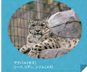
足裏を見せてくれたアクル。肉球の間にある毛が、滑り止めになります。