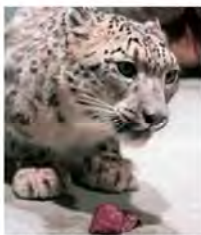
エサを食べるリアン。4頭とも週に1日、断食の日があるそうです。

ユキヒョウは、インドやネパールの高山帯にすむ、ネコ科の動物です。食肉目としては、最も標高の高い場所に生息しています。灰色や白い毛色と黒い模様、雪の中や岩場でのカモフラージュに優れます。その美しい毛皮を狙った狩猟によって数が減り、絶滅危惧種に分類されています。