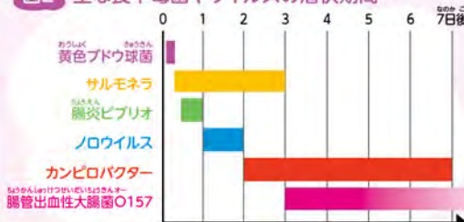
図2 主な食中毒菌やウイルスの潜伏期間

細菌やウイルスが原因の場合、体の中で増えたり、毒素をつくることで、食中毒の症状が出てくる。だから、図2にもあるように、細菌やウイルスのついた食べ物を食べてから症状が出るまで、時間がかかるのが普通なんだって。お腹が痛くなる直前に食べたものが、必ずしも食中毒の原因じゃないことも多いんだよ！