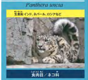
ユキヒョウ(オス) リベ、リアン、シジム(メス)