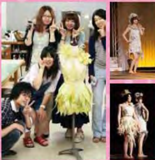
▲最終的にはミニのドレスに仕上げました