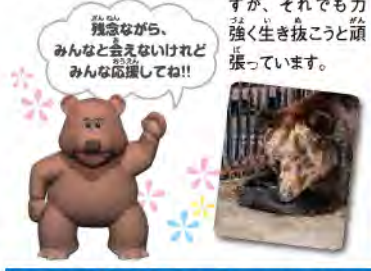
▲アメリカワウカゲ ▲コバルトヤドクガエル

内最高齢と思われる38歳の誕生日を迎えたエンソヒグマの「栄子」が、高齢のため歩行が困難になってしまいました。現在は動物園の職員による介護を受けながら室内で暮らしています。動物にとって歩行は食べる(生きる)ために必要で