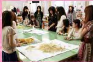
▲みんなでデザインを考えました