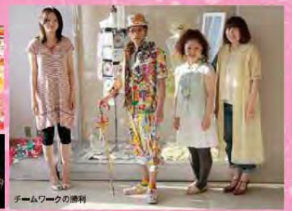
チームワークの勝利