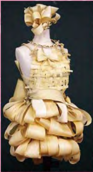
▲ドレスの名前は「皮カワ」(プロトタイプ)