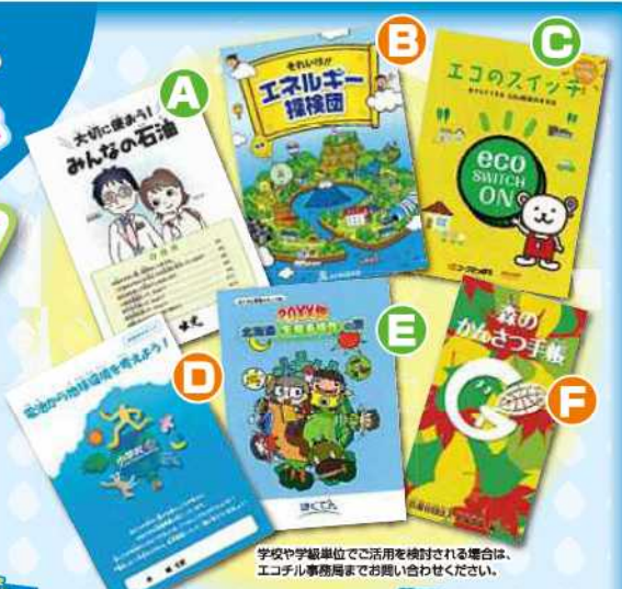
学校や学級単位でご活用を検討される場合は、エコチル事務局までお問い合わせください。

今回、ご紹介する環境ミニブックには、それぞれの企業や団体が環境のために研究して分かったことや暮らしに役立ててほしい工夫など、子供たちに知ってほしいメッセージが込められています。環境ミニブックで企業や団体が取り組む環境活動を学んで、キミも環境について考えてみよう!