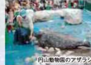
円山動物園のアザラシ

コなんだよ。 2つめは、雪冷房で貯蔵するとお米や野菜が美味しくなること。乾燥しやすい電気冷蔵庫と違い、湿度70%の雪冷房はとて