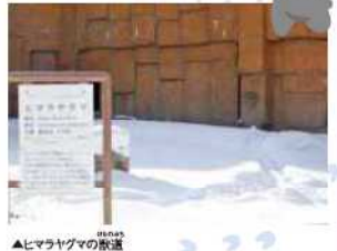
▲ヒマラヤグマの獣道

雪が降った後は、ぜひ動物園に訪れてください。それぞれの獣舎には、日常的に動物が通る道“獣道”を見つけてあげられるよ。動物の行動によって獣道のでき方はさまざま。行動の違いを見つけるのも楽しいです。この季節の動物園には、冬だからこそ発見が他にもいろいろあるので見つけに来てね!