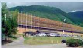
▲活動部 サットメディア 商業センター (2008年当時)