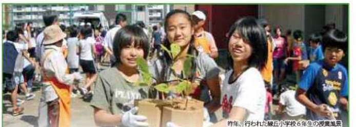
昨年、行われた東山小学校6年生の授業風景