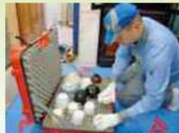
「えころじこんぼ」のひとつ「食器トランク」。ポリカーボネイト素材のケースにポリタンクが組みあがり、落としても中の食器も割れません

春は引越しシーズン。引越しをはじめ食品や美術品など、さまざまな荷物を全世界に運んでいる日本通運では、地球環境に配慮した配送に取り組んでいます。例えばそれは繰り返し使える梱包資材の開発。梱包資材というのは、大切な荷物が壊れないように包む資材のこと。引越しには、普通、紙やダンボールがたくさん使われます。「えころじこんぼ」は、そんなムダをなくしたいという日通の社員さんたちの思いから、生まれたのです。