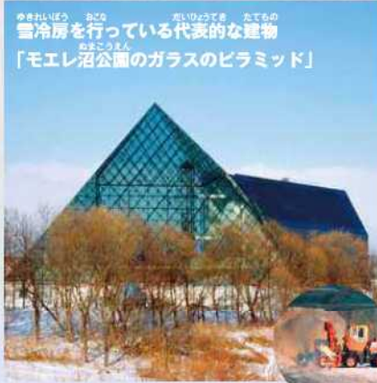
「モエリ沼公園のガラスのピラミッド」