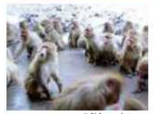
▲「まだないの?」この表情、さぞ美味しかったのでしょうね