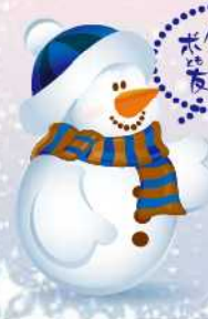
「雪冷房口」

自分もやってみたいという人も増えていっている。これからはいろいろ方法が開発されるといいなと思っているんだ!