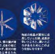
角板の結晶が扇形に成長していった例。成長が早いところと、遅いところがあるためにこのような形になります