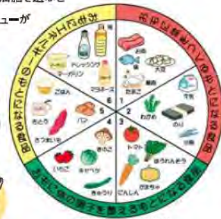
6つの基礎食品・3つの食品群