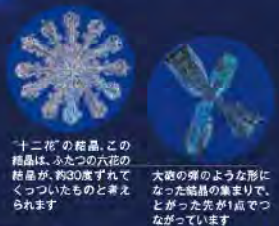
「十二花」の結晶。この結晶は、ふたつの六花の結晶が、約30度ずれてくっついたものと考えられます

の中谷青年は、大学で物理学を学び、火花放電の研究などした後、北大にきて、いよいよ雪の研究を決意したの。そして「先ず雪そのものをよく観る」ために、いろいろ工夫をしたのよ。