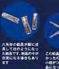
六角形の結晶が縦に成長して柱のようになった結晶です。結晶の中が空洞になる場合もあります