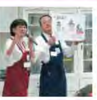
みそについての歴史を知ることができ、北海道産の大豆をつかった本格納豆みそ作り体験ができます。もちろんスタッフが順番にわかりやすく説明をしていくので誰でも簡単に出来てしまいます。

つてみそのタイプはかわり短い期間だと甘口、長い期間だと辛口のみそになります。昔はそれぞれの家庭でも造られておりましたが、現在では少なくなりましたが、造られてきたみそが主流となっています。 今回のイベントは福山醸造の協力により、今年で3回目です。