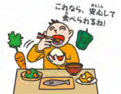
栄養成分表示の店ラベル