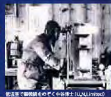
低温室で顕微鏡をのぞく雪博士(UWU, Inc.)

それで中谷博士はその雪の結晶をいくつかの仲間整理するの。雪の結晶の分類「雪の分類」という仕事に取り組んだの。