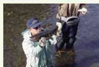
そよしてきたサケを観察しよう