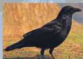
ハシブトカラス くちばしが細く、尾や草席などひらけた 場所をすんでいます。木や草の葉、虫、 動物の死体などなんでも食べます。