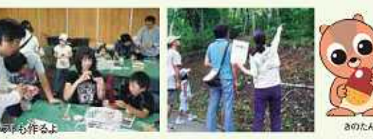
ドングリを使ったクッキーも作るよ