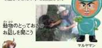
動物のとっておきのお話を聞こう