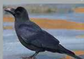
ハシブトカラス ひたいがだらばり、くちばしが太い。 樹皮や山椒の森にすんでいます。 人間がたすゴミをおならせにしています。 木の葉などの腐敗臭のエサ、魚、小動物、 昆虫などの動物臭のエサなど、なんでも食べます。