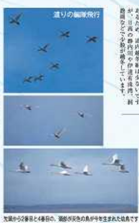
先月から24日と4日、渡りが完了した鳥が生まれた地島です

私たちが、家族の渡り旅プランは、ふるさとから南下してアムール川のあたりからサハリン経由で北海道に渡り、道北のクッチャロ湖で何日か休んでから、マガンさんが連れて休んでいる美瑛の宮島沼をかすめつつ、苦