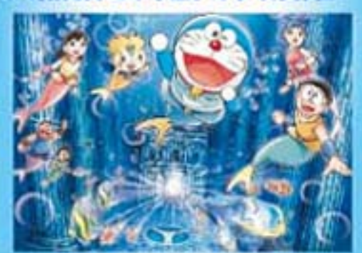
映画ドラえもん30周年記念作は、 人魚伝説をめぐる超大作