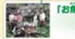
「お魚殖やす植樹運動」記念の森 当別町 道民の森

当別町と当別町に広がる「道民の森」の中に平成10年、「お魚殖やす植樹運動」記念の森ができました。約10周年を記念してつくられたもので、お魚殖やす植樹運動のシンボルです。お魚殖やす植樹運動のシンボルです。お魚殖やす植樹運動のシンボルです。