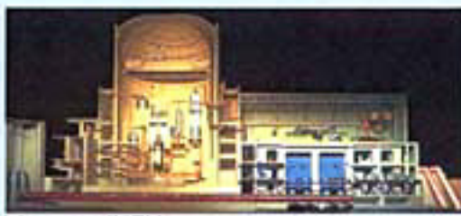
楽しみながら発電所のしくみがわかるマジックビジョン

今回のエコチルプレイスは西積丹にある原子力PRセンター「とまりん館」です。 「とまりん館」には遊びながら科学の不思議に触れることができる「科学展示」、ニセコ山系、羊蹄山に生育している高山植物や、発電所周辺で発見された土器や釣り針、真珠などの埋蔵文化財などから西積丹の自然や歴史を知ることが出来る「地域展示」、実物大の模型やパネル、泊発電所の25