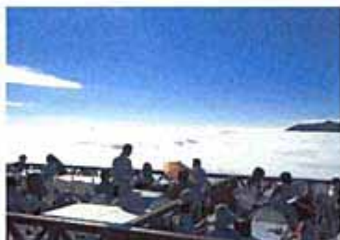
一面の雲の海(雲海)が広がる雲海のテラス。幻想的な風景が広がります。(6/19~9/17)