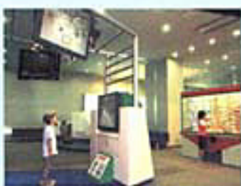
とまりんエナジークエスト

エコチルのオススメその1は原子力展示の「測ってみようあなたの放射線」。私たちの身のまわりには大昔からいろいろなかたちで自然の放射線が存在しています。実は皆さんの体からも出ているんですよ。この展示では自分の体からどのくらいの放射線が出ているかを測ってみることが出来ます。オススメその2は科学展示の「とまりんエナジークエスト」。ゲームの映像の中に入り込んで、遊んで楽しみながらいろいろな発電方法の仕組みなどが学ぶことが出来ます。