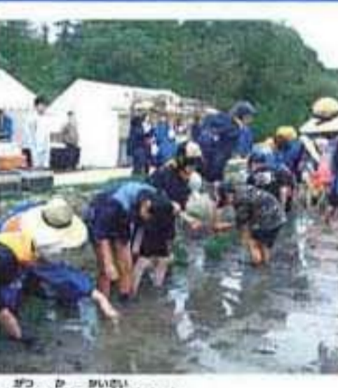
6月2日に開催された「えこりん村 田植えまつり」の様子