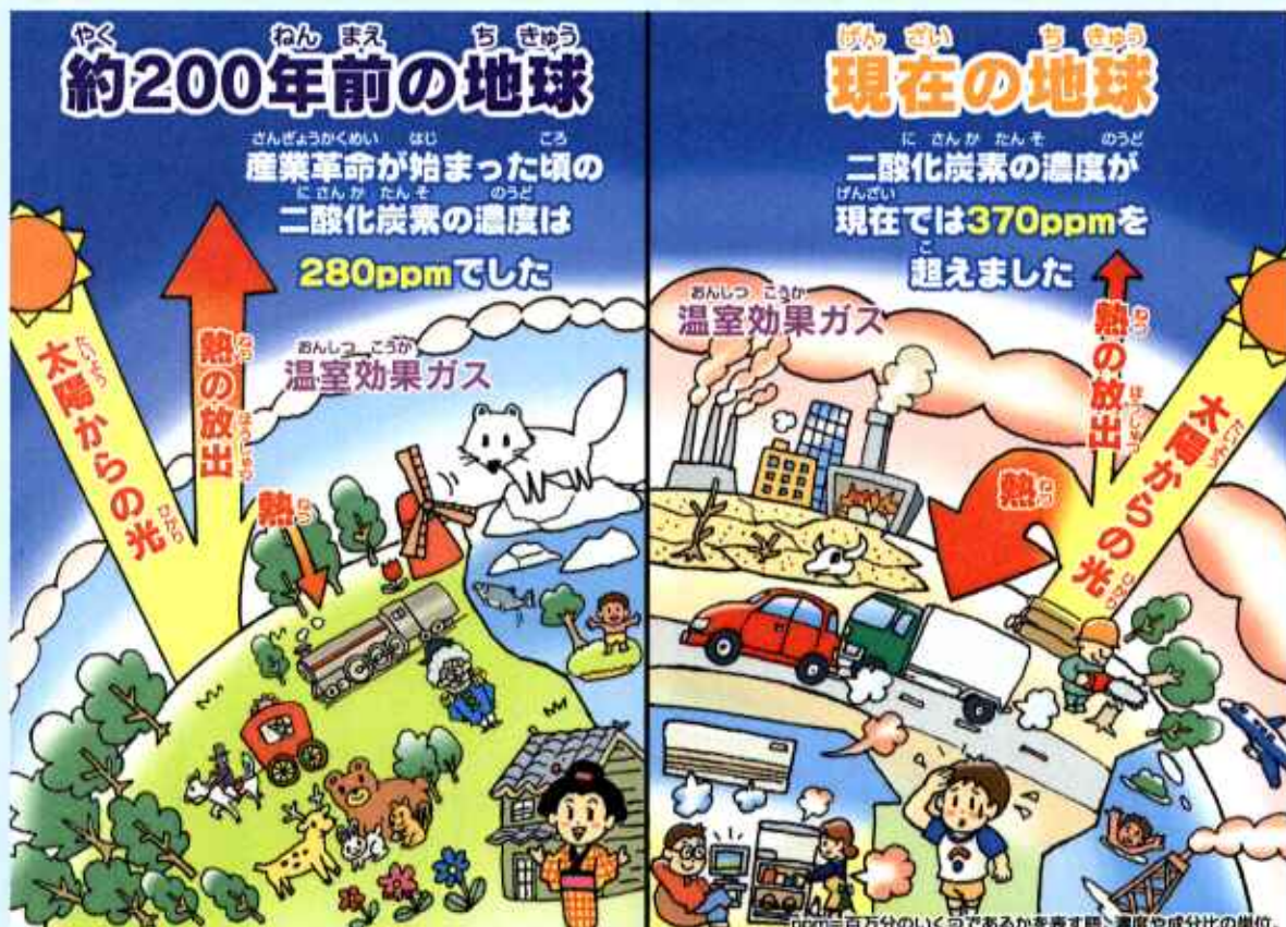
左側は200年前の地球です。太陽の光が地球を暖めて発生した熱は宇宙に流れて、地球はちょうど良い気温が保たれています。右側は現在の地球です。太陽の光が地球を暖めて発生した熱は、二酸化炭素などの温室効果ガスによって、なかなか宇宙に流れて行きません。(ビニールハウスのようになっています。)

では、地球温暖化になるとどんなことが起こるのでしょうか？地球温暖化が進むと世界各地で、海面上昇による居住地面積の減少や洪水発生が増加、地球規模での飢餓への可能性、蚊などによる伝染病の増加の恐れなどさまざまな影響が考えられています。