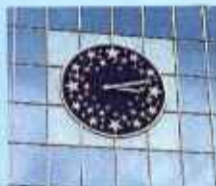
ソーラーシステムを利用した星の大時計。太陽電池で時計を動かしています。

古小牧産の天然ガスを使って電気を作り、JRタワー全体の80%の電力をまかなっています。写真はガスタービン発電機。飛行機のジェットエンジンと同じ構造です。当日は再生資源室や、天然ガスを使ったコージェネレーションの施設、太陽電池が使われている「星の大時計」、「風太郎」などを見学することができます。スタッフの方が説明してくれて、みんなの質問にも答えてくれますよ。