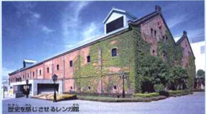
歴史を感じさせるレンガ館

今回は、ショッピング、レジャー、グルメなんでも揃っているサッポロファクトリーです。皆さんもよく行かれるのではないのでしょうか? サッポロファクトリーはサッポロビールの工場跡地に作られた大正時代のレンガ館も残る建物で