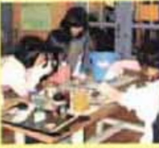
石けん作りの材料は使用済み油と水。苛性ソーダは危険な薬品なので先生が計量します。みんなは興味深々、ちょっとドキドキ。

この冬は例年になく暖冬で、暖かい日が続きました。みんなも改めて地球温暖化について考えさせられる冬休みだったのではないのでしょうか。大人も子どもも、地球のために何が出来るか、考えなくてはなりません。厚別西児童会館のサイエンスクラブは「子どもたちの身近な疑問に応え、楽しい科学を紹介したい」と、3年ほど前に作られました。3年生の女の子を中心に、水や空気、ドライアイスなどを使い、毎月1回、色々な実験をしています。1月10日に今年の第1回目が開催され、お友だちはふだんゴミとして捨ててしまう使用済み油を持ち寄