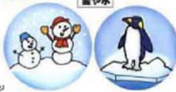
参考資料：新エネルギー開発ホームページ

冬の間に積もった雪や、水を冷たい外気で氷にしたものを貯蔵しておいて、夏に建物の冷房や農作物の冷蔵に利用することを、「雪氷熱利用」といいます。