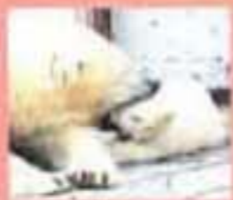
2005年12月15日生まれたピリカの外見がかわいい。ぬいぐるみみたいですね!

ホッキョクグマたちの大好きな雪の季節がやってきました。先月1子になったピリカも毎日、雪遊びをしています。何かが雪が珍しいみたい…。そう、実は円山動物園で生まれたピリカはホッキョクグマの故郷である北極を知らず。ですからホッキョクグマのくせに、雪や氷が珍しいのです。もうすぐ他の動物園に行くことになっているピリカ。親子で遊ぶホッキョクグマを見る最後のチャンス!ぜひ会いに来てくださいね。