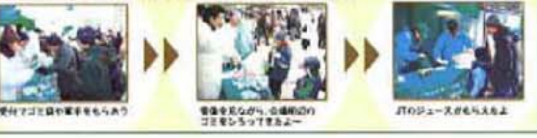
受付アゴと軍手ももらおう 看板を見ながら、会場周辺のゴミをひろってきましょう JTBのジュースがもらえよう

この運動は、「街に落ちていくごみをひろってみることでボーリングとはいけない」ということを実践してほしい。「ひろっている姿を見た人たちにもボーリングについて教えてもらおう」という思いから全国各地でおこなわれています。