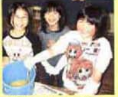
材料を混ぜ合わせると発熱するのでビックリ。混ぜていると油の固まりがします。

り、石けん作りに挑戦しました。集まった油は全部で1リットル。苛性ソーダは触れると火傷のようになる危険な薬品なので、先生が計量してくれました。