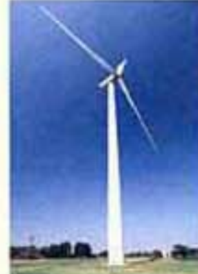
写真3 今年9月より動き始めたかざみ。(千歳市)

先生もみなさんも、地球温暖化に対して一緒に戦う仲間です。ひとりひとりの力は小さくても協力できる仲間がたくさんいます。まずは自分の身近なエコロジイを探してみましよう。