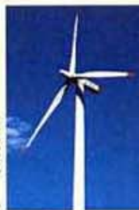
写真2 石狩市にある市民風車「はまかせ」ちゃん

みなさん、「市民風車」を知っていますか？ 自然エネルギーの代表ともいえる風力を使って発電する風車、「市民風車」とは、市民がお金を出して作る風車のことで、日本では、2001年9月に北海道浜頓町に第一号(※写真1)が建てられました(企業が建てた風車は以前からありました)。