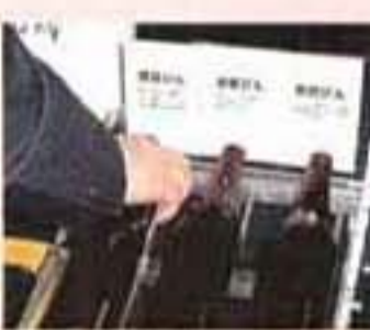
どれどれ、比べてみると……みんなぜひ試してみてください!

また、ビールといえはびんビール。あの茶色のリターンびんもエコの優等生です。使用済みびんの回収率がほぼ100%以上に、1度作られると、なんと1年間に2〜3回繰り返し使用され、約8年間、実に20〜24回も使用されるのだそうです。明治時代からすでに始まっていたといわれるビールびんのリサイクルですが、キリンビールでは2003年には、すべてが大びんが軽量びんに切り替えられました。これは従来のびんに比べ約2割も軽く、省資源だけではなく物流の効率化にもなり、二酸化炭素の排出抑制にも一役買っています。見学用通路に軽量びんと従来のびんの見本が並べられていて、