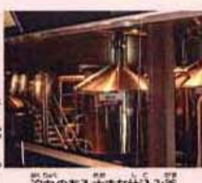
迫力のある大きな仕込み釜

おいしい食べ物や飲み物の原料はすべて自然から生まれたもの。この地球上に、恵み豊かな自然が存在するからこそおいしいだけなのです。キリンビールさんでは「50年後、100年後もおいしいビールが飲めますように」を合い言葉に、自然環境に配慮した製品づくりや、植林などの環境保護活動が行なわれています。1990年、キリンビール全社において2010年までに二酸化炭素の排出量を25%削減するという目標をたてまし