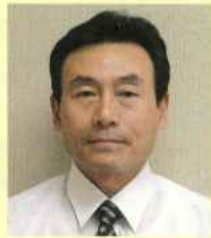
小さなことから積み重ねよう!

車大国の日本で車を乗らないことはできないかもしれないけれども、ほんの小さな努力からはじめよう!