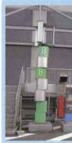
札幌駅のホーム上の 駐車場にある「風太郎」。 風力発電を利用した、 駐車場の案内塔です。

生活が豊かになり、エネルギーの消費量はふえ続けていますが、石油などの化石燃料は使い続けるといつかはなくなってしまう、限りある資源だということを忘れてはいけません。新エネルギーはこれからもっともっと開発が進み、使われるようになるでしょう。今まで捨てられてきたものを資源として見直し活用していくことで、大切な地球を守る事ができるのです。