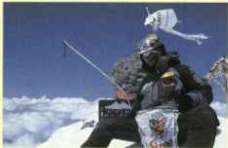
ヨーロッパ最高峰にて

いることがあり、地球温暖化は確実に進んでいると実感することがあるそうです。人間がいなくなったら、地球は美しいままだったかもしれない。人間の意識をどう変えていくかで、美しさは残せるはずなんです。