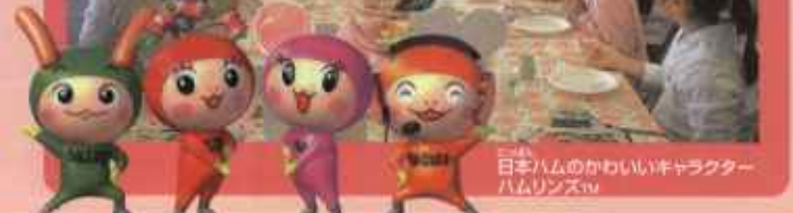
日本ハムのかわいいキャラクター ハムリンズ