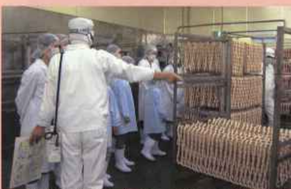
できたばかりのウインナーに、「わー! なか〜い!」とびっくり。

しまいますね。 そんなとき、その商品が 環境にやさしい商品かどう かを選んでみませんか? 同 じように見えてもちがう角 度から考えてみると新しい 発見があるかもしれません。 商品が作られる途中で 二酸化炭素が出ないのも 大切なポイントですね。ほ かにもどんなところが環境 保護につながるのが、絵に してみました。みんなも他 にどんな商品が地球にやさ しいかお家の人やお友だち と調べてみてね。