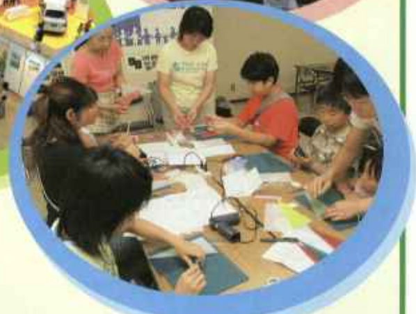
※写真は昨年の会場の様子です。

今年で9回目をむかえる、北海道最大級の環境イベント、環境広場さっぽろ。今年のテーマは「守るものがある~私たちの豊かな地球」。今年もここだけのオリジナルエコストーリー「轟轟戦隊ポウケンジャーショー」、「Mrマサックのなぜ?なに? 新エネルギー実験ステージ」など環境について考えるイベントがもりださくさん! 期間中は大谷地バスターミナルから会場まで、天然ガスを利用した無料シャトルバスもあるので、ぜひ遊びにきてね!