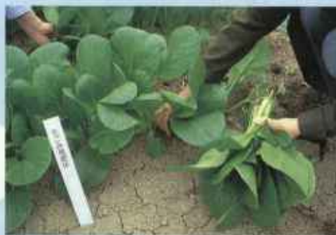
生ごみたい肥で育った小松菜。取材班もさっそく収穫してみました！ゆでて食べると、あまくてとってもおいしかったよ！

そうです！生ごみたい肥には、作物を育てるために必要な栄養がたっぷり含まれているんですね。試験栽培の後、実際にこの安全な生ごみたい肥を使って、市内の農家の方が小松菜、しゅんぎく、いんげん豆、とうもろこしを栽培。これらで新鮮な野菜は、今年のもデル校になっている山の手南小学校と八軒北小学校の9月の給食メニューの食材となって登場します。