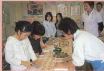
ウインナーをかわいい動物の形にする飾り切り。上手にできるかな?

続けられています。また、工場のまわりのゴミ拾いなども行なっています。環境にやさしい工場で、素材を大切にしたいおいしいハムやウインナーが作られているのです。 工場見学はガラス越しではなく、実際に工場の中に入り、みんなの大好きなウインナーやソーセージ、ベーコンなどの製造工程を見ることが出来ます。食べ物の工場ですから小さなほころも見逃