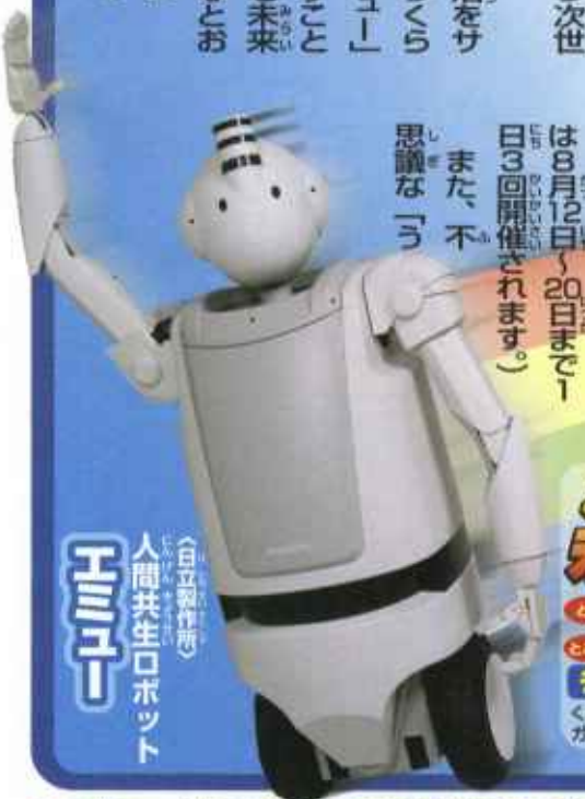
日立製作所 自立型ロボット エミュー