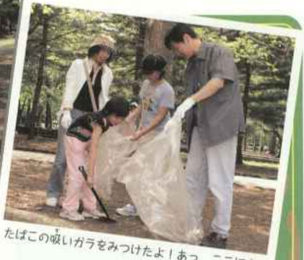
たばこの吸いガラをみつけたよ! あっ、ここにも。