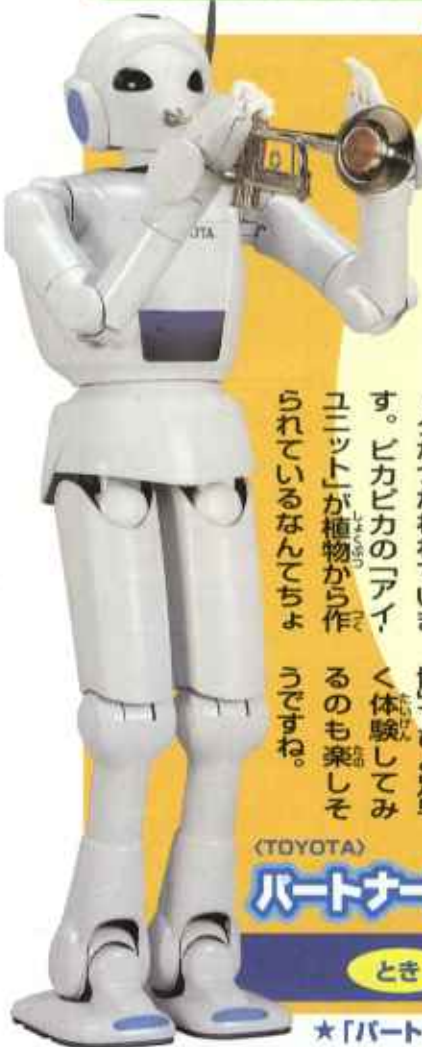
(TOYOTA) パートナーロボット

こども未来博はHPでもチェックできます。 http://www.sapporo-cci.or.jp/