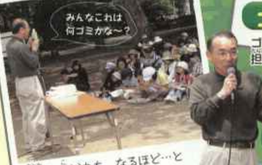
みんなこれは何ゴミかな〜?

6月4日(日)、さっぽろ円山公園においてエコチルクリーンアップ大作戦を開催しました。当日は気持ちのよいお天気に恵まれバツグンのゴミ拾い日和! 抽選で選ばれた100名の親子連れとエコチルスタッフで、有意義な一日を過ごしました。10時からの開会式の後、各自、軍手に火ばさみ・ゴミ袋を持ってゴミ拾いへGO!! 一生懸命ゴミ拾いをしたあとはゴミ分別講座でお勉強。お家に帰ってからもしっかり分別しましょうね。