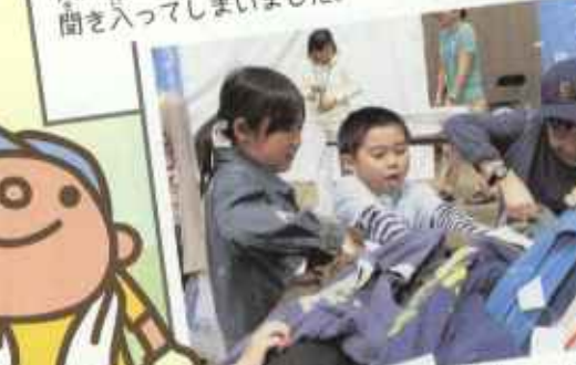
古着のつめ放題ゲームで 大もりあがり!