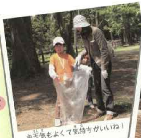
お天気もよくて気持ちがいいね!