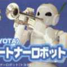
(TOYOTA) パートナーロボット