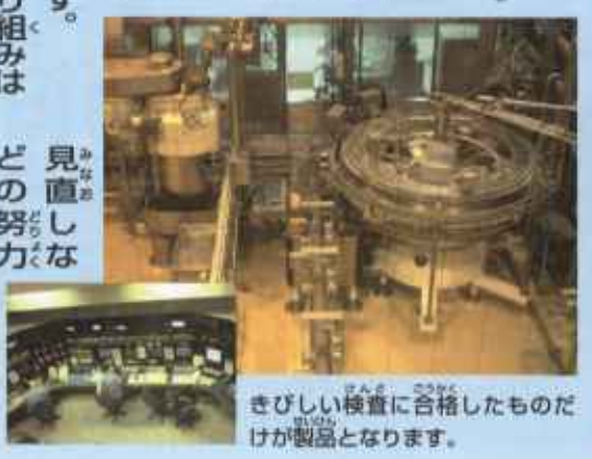
きびしい検査に合格したものが製品となります。

北海道を代表する大きな工場は、エコでもピカイチの工場でした。 工場に着いてまずおどろいたのはその広さと公園のように豊かな緑でした。広大な敷地内にはレストランとパークゴルフ場、それにピオトップと呼ばれる生き物達の場所があり、なんと工場敷地の約半分が緑地なのです。こちらの工場は2001年7月に緑化推進 省エネへの取り組みは、まず水の節約から始められました。工場では資源 回収された水を洗うための、皆さんの水が使われま す。以前は本分の水が12を1本つくびんビール す。以前は使われま さんの水がため、たくびんを洗う 回収された水を洗う ます水の節約から始められ ました。工場では資源