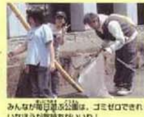
みんなが毎日遊ぶ公園は、ゴミゼロできれいなほうが気持ちいいね!

地域のみなさんと一生懸命ゴミ拾いをしたよ。おなかすいた後のお昼ご飯はさぞおいしかったことでしょうね。「おなかすいた後のお昼ご飯はさぞおいしかったことでしょうね。」