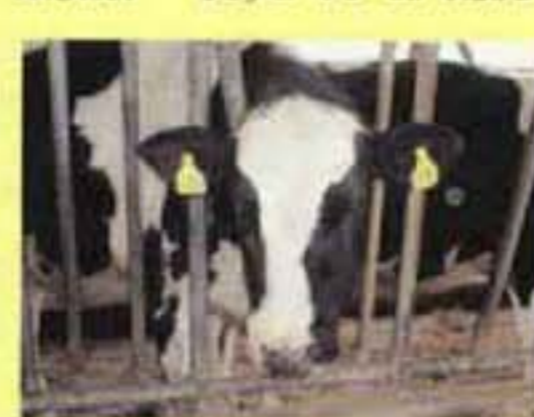
「牛の館」では牛たちがお出迎え。乳牛も赤 ちゃんを産んで初めてミルクが出るんだね!

サツラクさんの牛乳工場では、地球環境のことを考 え、た取組みがされています。クリーンなエネルギーもその ひとつ。じっくりお話を聞いてきました。