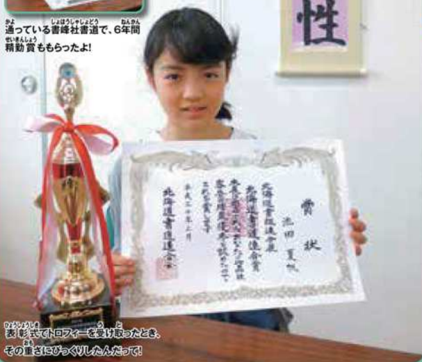
お祝い 表紙でドローイングを その重さにびっくりしたんだって!