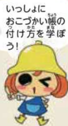
コーリンちゃん キャリアルの読者、みんななどいっしょにいる人などを学んだり、お仕事を紹介したりするよ!

みんなは、おこづかいをもらっている? もらっている人は、そのお金で何を買ったか記録しているかな? 今回はおこづかい帳の付け方のポイントを紹介しますね。