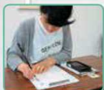
かよって しょうしよくを ぬかぬか 通っている書籍社普通で、6年間 おもしろい 精読賞ももらったよ!